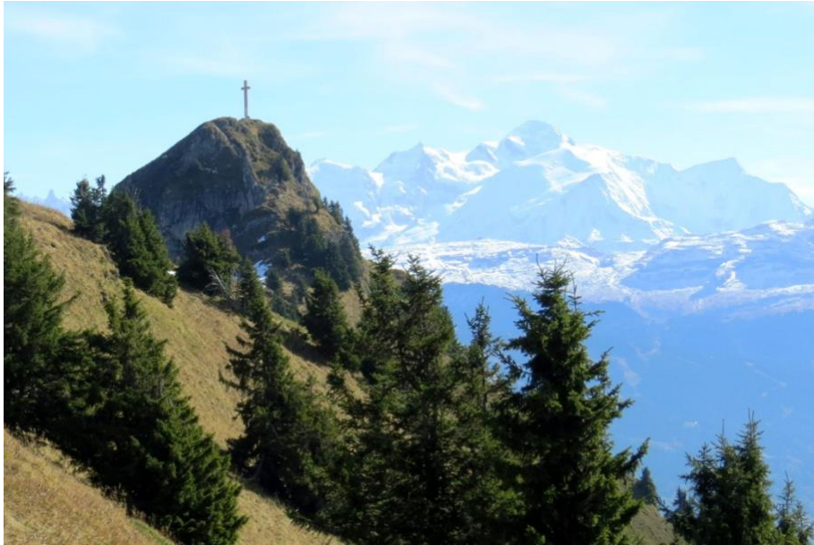
La vue sur le massif du Mt Blanc et la Croix de Marcelly