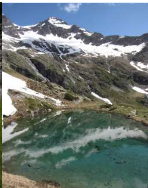
Le Lac bleu