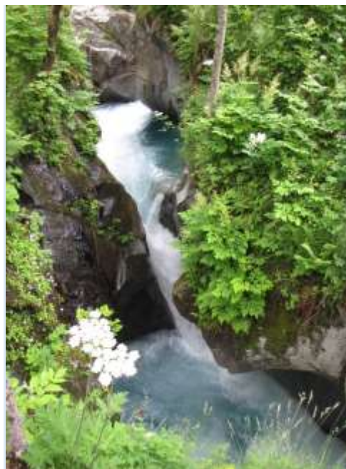
Les Oules du Diable