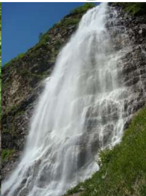
Le voile de la mariée