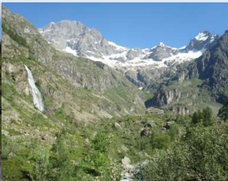
Le cirque de Gioberney et son refuge

Les points forts : 8 personnes max, séjour en étoile (sac à dos léger), les + beaux sites et hébergements de qualité.