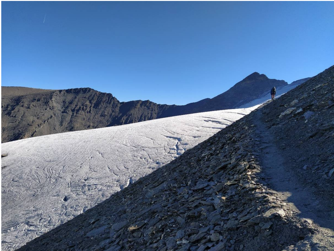
Evolution en bordure de glaciers à plus de 3500m d'altitude !

Aucun transfert n'est prévu. Vous aurez votre sac à dos au complet à la journée avec vous.