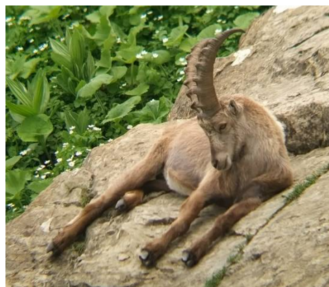
Bouquetin des Alpes