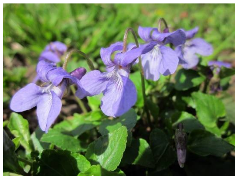
Violettes à feuilles pennées