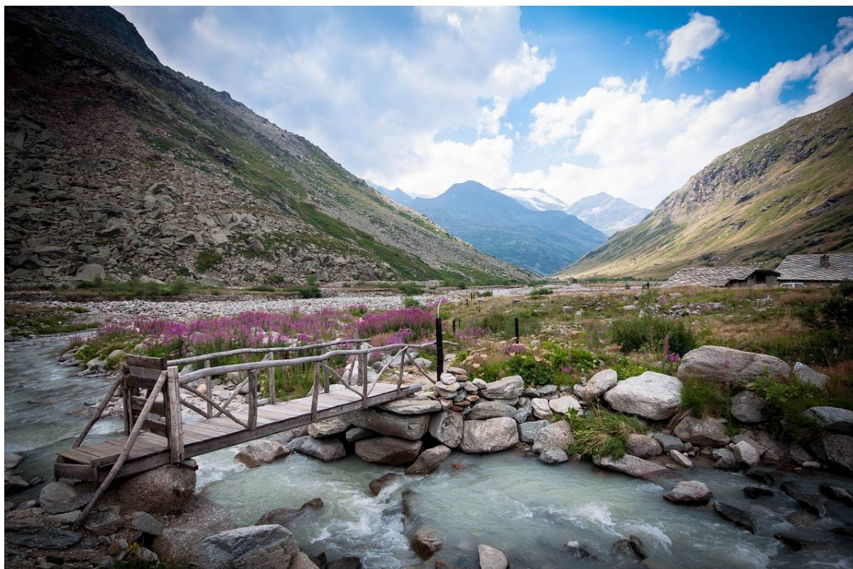
Entrée de la Réserve Naturelle de la Grande Sassièrè