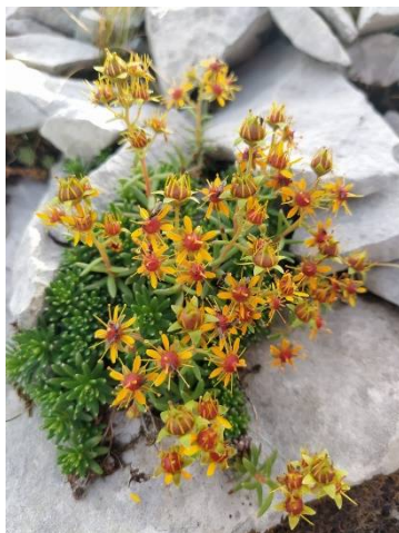
Saxifrage faux orpin