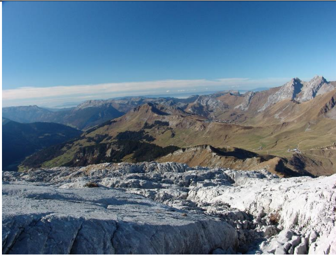
Un vaste lapiaz aux allures de glacier