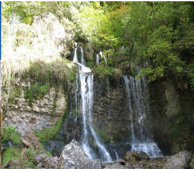
La cascade de Doriaz